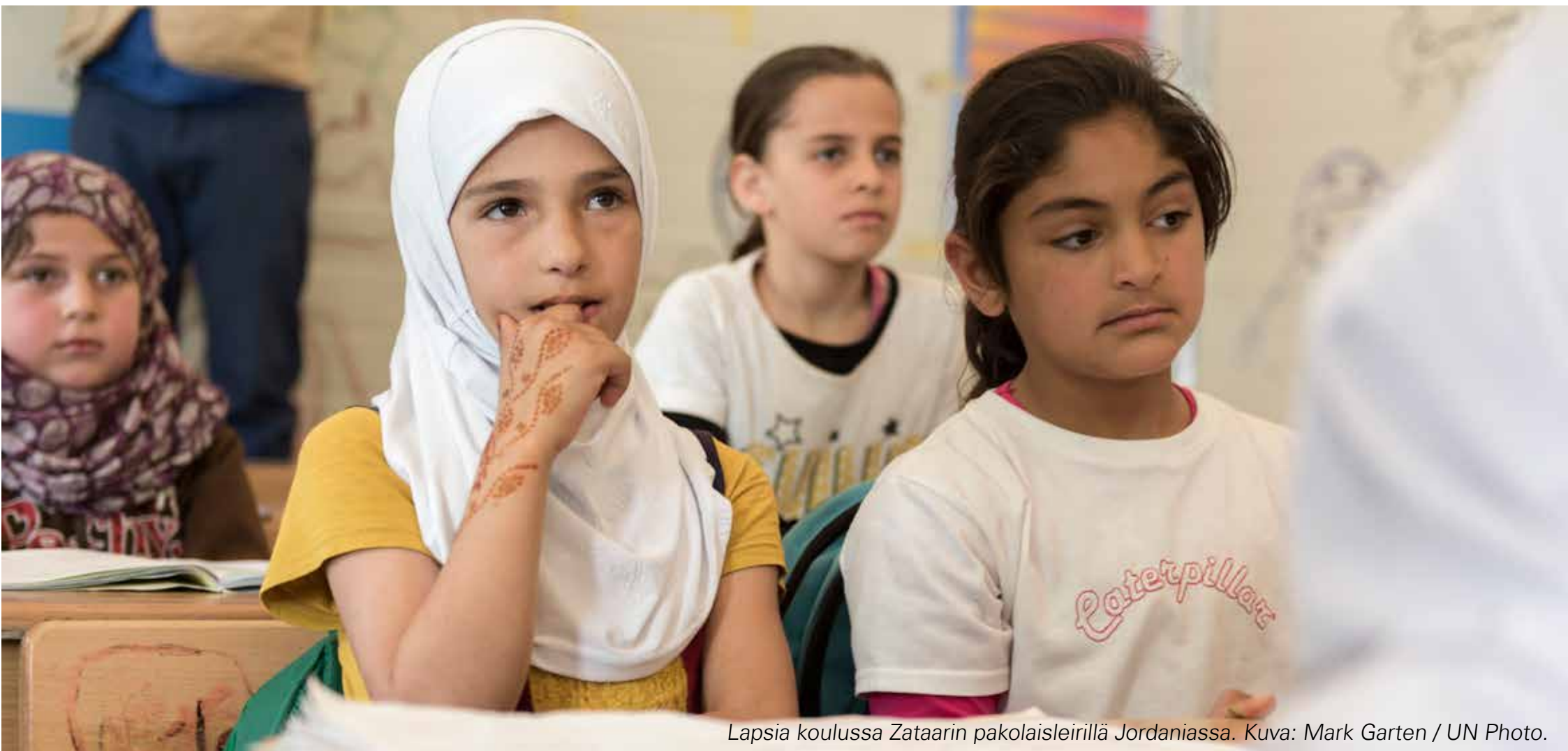
Lapsia koulussa Zataarin pakolaisleirillä Jordaniassa.

Myös esimerkiksi tutkimuslaitos IIASA:n ennusteen mukaan vuoteen 2050 mennessä enää viidessä maassa yli viidenneksellä ihmisistä ei ole lainkaan koulutusta.