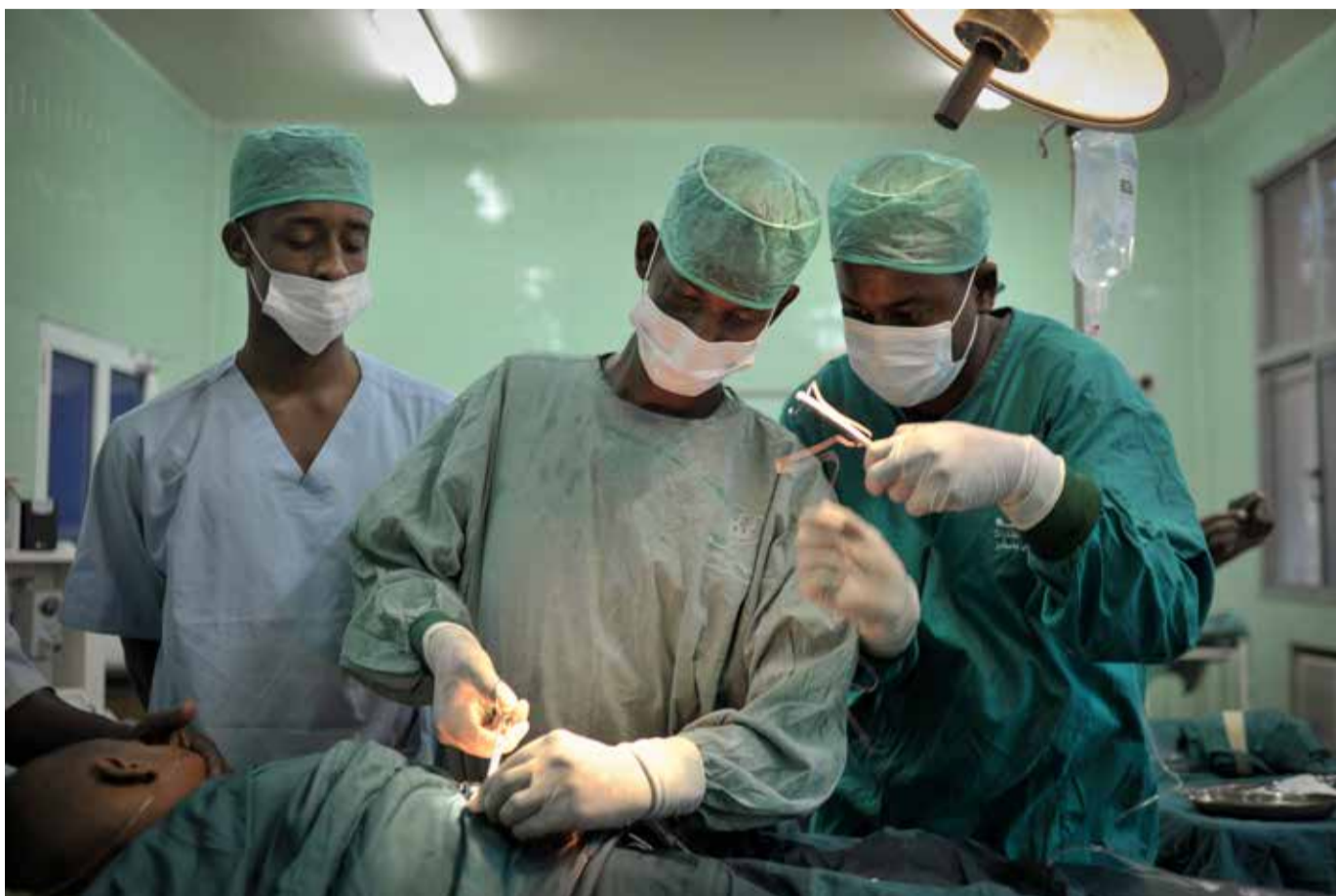
Lääkärit leikkauksessa Mogadishussa, Somaliassa.

”Viime vuosikymmenten lisääntynyt yhteistyö ja glo-