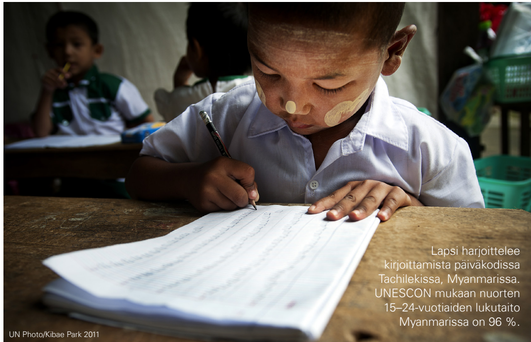
Lapsi harjoittelee kirjoittamista päiväkodissa Tachilekissa, Myanmarissa. UNESCON mukaan nuorten 15–24-vuotiaiden lukutaito Myanmarissa on 96 %.

Vaikkapa innostavia ihmisiä, uusia ratkaisuja tai keksintöjä, yksittäisiä hyviä uutisia, muutosta parempaan tai tilastotietoa.