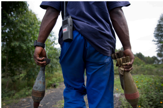
YK:n miinanraivaaja kerää hylättyjä ammuksia Kongon demokraattisessa tasavallassa.