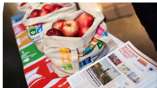
Maailman parhaita uutisia jaetaan ja luetaan ahkerasti YK-liiton tapahtumissa.

“Koska uutismaailmaa hallitsevat huomiota herättävät, useimmiten negatiiviset uutiset, tarvitsemme myös ymmärrystä lisääviä, positiivisia kehitysuutisia, jotta hahmotamme maailmaa realistisemmin. Tasapainoisempi uutisointi luo samalla uutisten kuluttajille, kansalaisjärjestöille ja poliittisille päättäjille paremmat edellytykset vaikuttaa asioihin.”