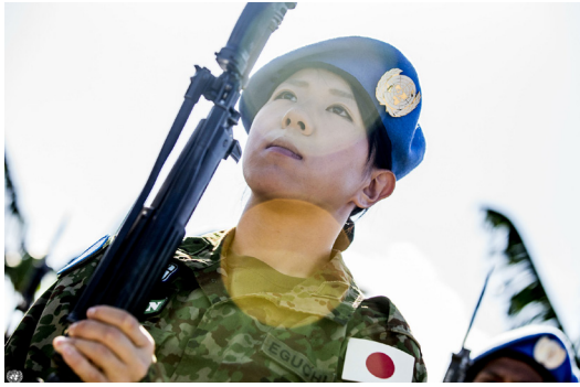
Rauhanturvaaja YK:n rauhanturvaajien päivän tapahtuman harjoituksissa.