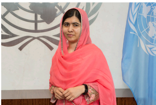
Malala Yousafzai on YK:n kaikkien aikojen nuorin rauhanlähettiläs. Hän sai Nobelin rauhanpalkinnon vuonna 2015.

MINKÄLAISIA HYVIÄ UUTISIA VOISIT KIRJOITTA LIITTYEN TÄMÄN AUKEAMAN KUVIIN?