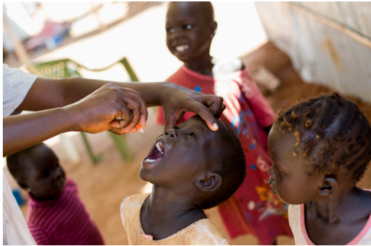
Lapset saavat polio-rokotuksia Jubassa, Etelä-Sudanissa.